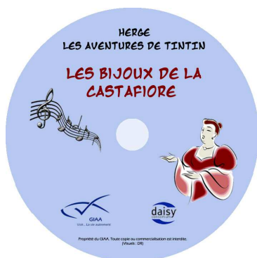
Les bijoux de la Castafiore