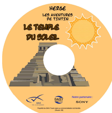
Le temple du soleil