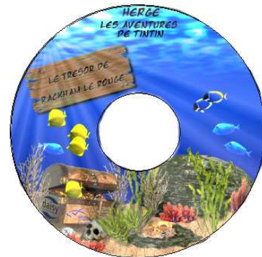
Le trésor de Rackham le Rouge