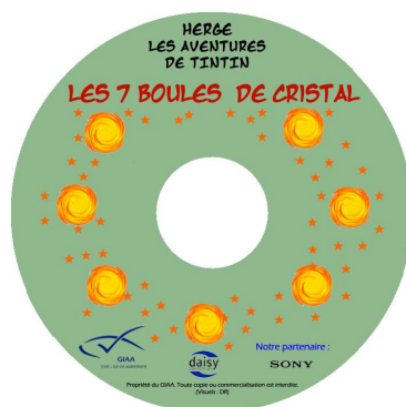
Les 7 boules de cristal