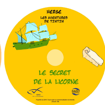
Le secret de la Licorne